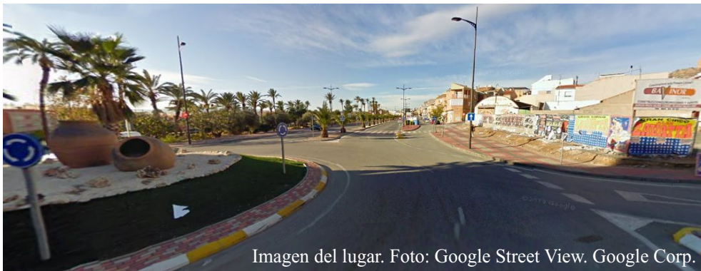
Imagen del lugar.

Entre los compromisos y contratos que firmó entonces, uno fue con la empresa Bavinor, propietaria del solar de Estrella de Levante. El objetivo era la cesión de una parte del solar para ejecutar la rotonda de las tinajas. A cambio, se le ofrecían dos alturas