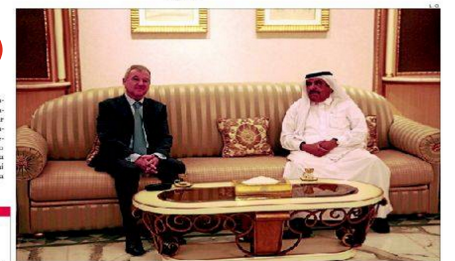
El presidente Valcárcel junto al príncipe heredero y vicesgobernador de Dubái, Hamdan bin Mohammed bin Rashid

LA FELIZ GOBERNACIÓN Un sueño de película JAVIER MONTIEL