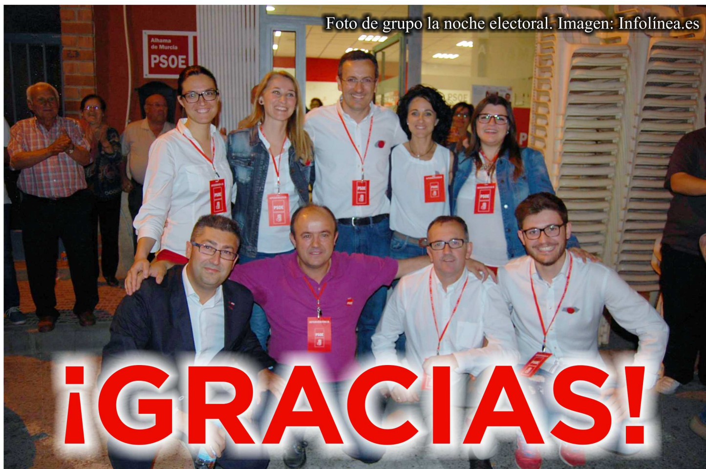
ELECCIONES LOCALES EN ALHAMA 2011

Foto de grupo la noche electoral.