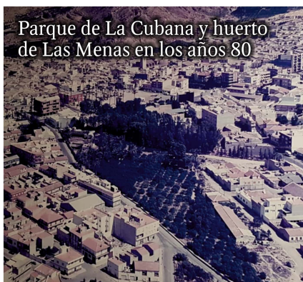
Parque de La Cubana y huerto de Las Menas en los años 80