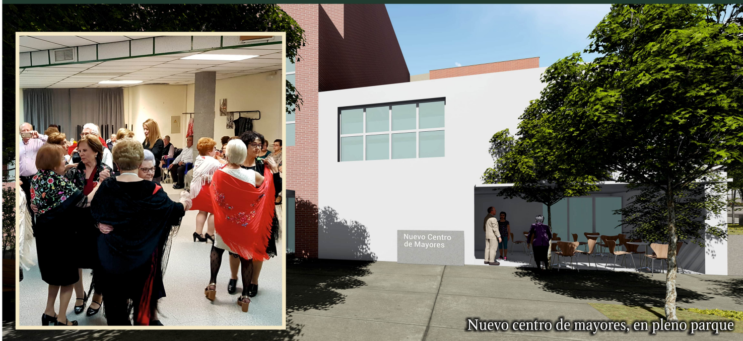
Nuevo centro de mayores, en pleno parque

adaptado a las necesidades de espacios y usos que reclaman sus usuarios/as