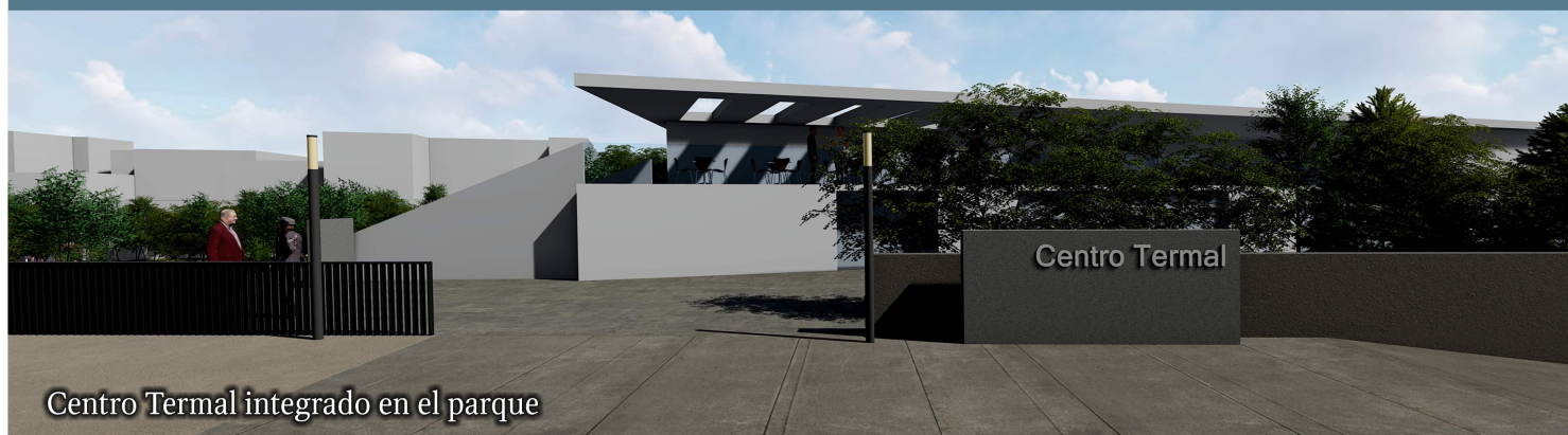
Centro Termal integrado en el parque

como elemento de puesta en valor de las aguas termales y recuperación de la identidad de Alhama