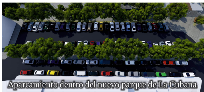
Aparcamiento dentro del nuevo parque de La Cubana

► El reciente acuerdo de arrendamiento con los propietarios del solar de la calle Severo Ochoa permitirá el aparcamiento gratuito de más de un centenar de vehículos a pocos metros del centro, al que hay que sumar otras cien plazas más, como mínimo, contempladas en el proyecto de remodelación del parque.