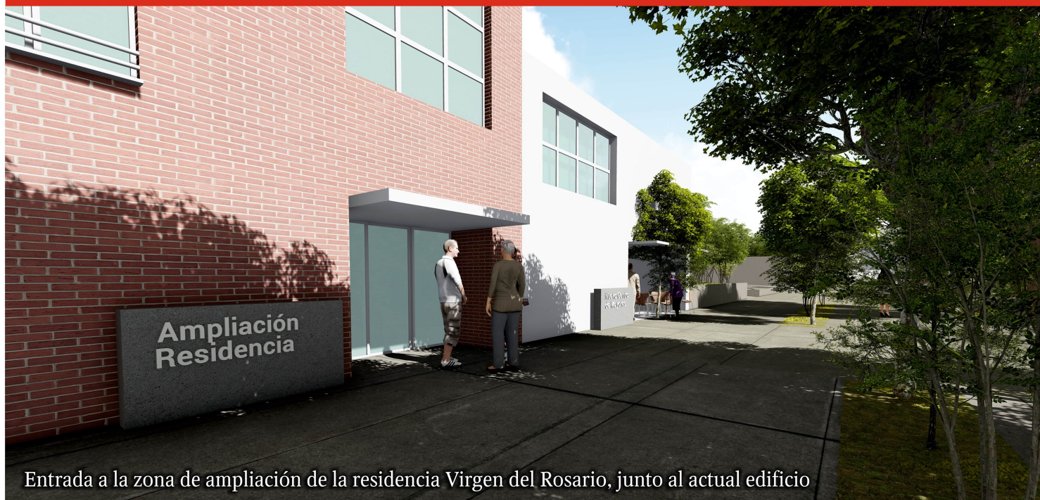
Entrada a la zona de ampliación de la residencia Virgen del Rosario, junto al actual edificio

Hay muchos alhameños que se tiene que alojar en otros municipios por la falta de plazas