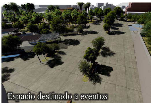
Espacio destinado a eventos

► El proyecto de remodelación del parque contempla la disposición de un espacio de más de 1.500 metros cuadrados destinados a eventos, como conciertos, mercadillos, teatro, actividades infantiles, ferias, fiesta de la matanza y otras propuestas se puedan recoger a través de la participación ciudadana. Este lugar, ubicado donde se encuentra actualmente el solar de tierra a espaldas de la residencia, estaría perfectamente integrado en el parque, dispondría de espacios verdes pero con la amplitud suficiente para la instalación de escenarios, carpas, casetas y asientos. Nuestra juventud por fin contaría con un lugar al aire libre que le permita llevar a cabo todo tipo de actividades.