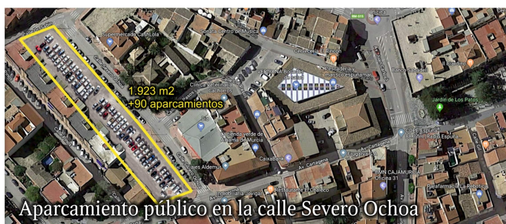
Aparcamiento público en la calle Severo Ochoa